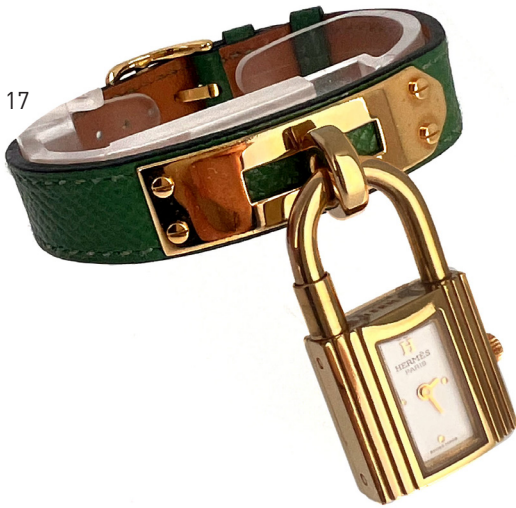
17 | HERMES PARIS Montre "Kelly" en cuir epsom vert et métal dore. Très bon état. 800 / 1000 €