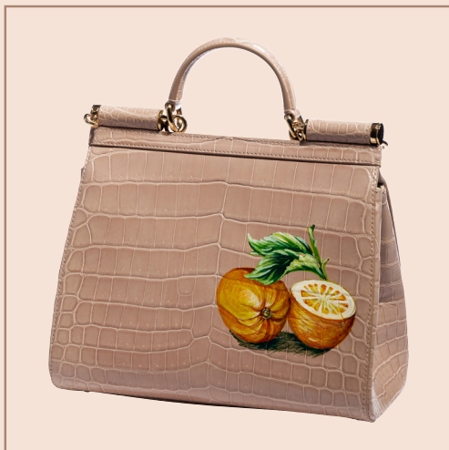
20 | DOLCE & GABBANA Edition limitée Sac "Sicily" 25 cm e n crocodile rose pâle, garniture en métal doré, rabat aimanté rehaussé d'une nature morte, poignée, anse bandoulière amovible Parfait état 2000 / 3000 €