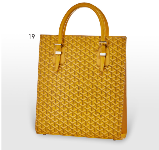
19 | GOYARD Sac "Comores" 34 cm en goyardine et cuir jaune, double poignée réglable 600 / 800 €