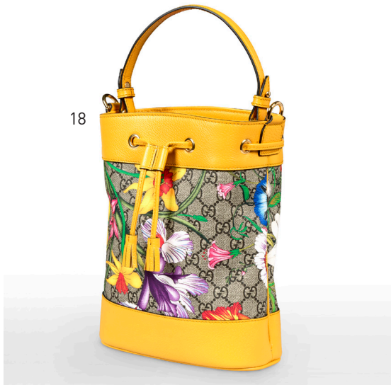
18 | GUCCI Sac seau en toile supreme GG et veau souple jaune. Intérieur en tissus beige. Avec bandoulière, dustbag et boîte. Etat neuf. 900 / 1300 €