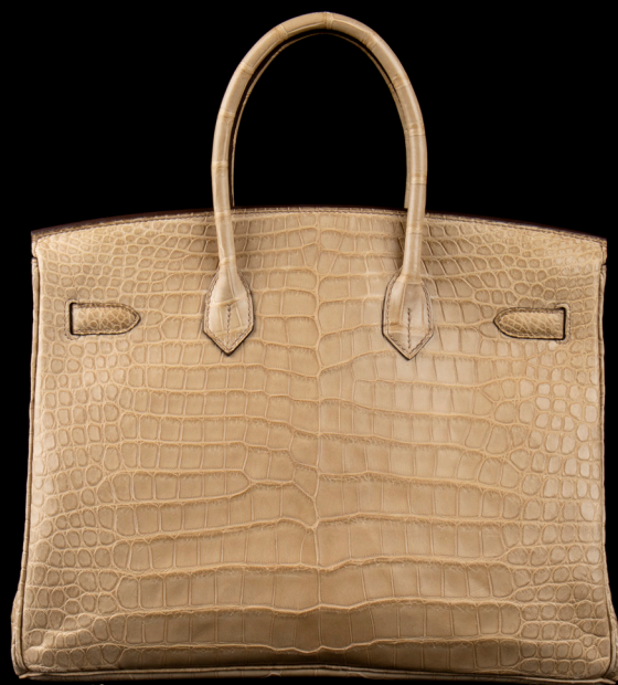
46 | HERMES PARIS MADE IN FRANCE Sac "Birkin" 35cm en crocodile Porosus Poussière, garniture en métal plaqué or. Avec tirette, clochette, clés et cadenas, dustbag. Dans sa boîte. Circa 2008. Excellent état. 20000 / 25000 €