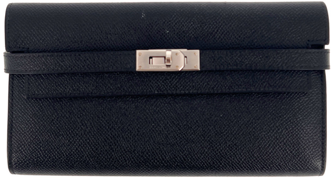
40 | HERMES PARIS MADE IN FRANCE Portefeuille "Kelly classique To Go" en veau Epsom noir. Très bon état Dans sa boîte. Circa 2010. Très bon état. 1000 / 1500 €