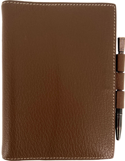
41 | HERMES PARIS MADE IN FRANCE Couverture d'agenda "Vision" en cuir mysore étoupe surpiqué blanc. On y joint un stylo en argent. Circa 2009. Bon état (usures d'usage). 60 / 80 €