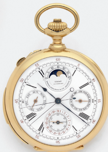
PATEK PHILIPPE Vers 1907 N°138067 Montre de poche