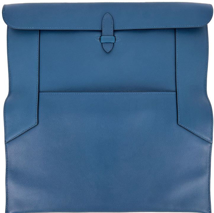
42 | HERMES PARIS MADE IN FRANCE Pochette "Pliplat" en veau Evercolor Bleu de Galice. Dans sa boîte avec dustbag. Circa 2013. Très bon état 1000 / 1500 €