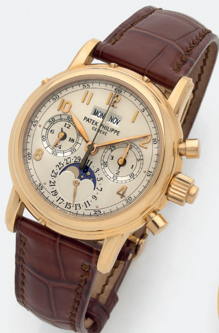
PATEK PHILIPPE Réf. 5004R-014 Vers 2008 Modèle chronographe