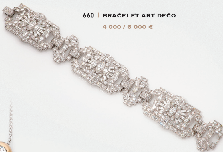
660 | BRACELET ART DECO 4 000 / 6 000 €