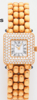
708 | CHOPARD HAPPY DIAMONDS REF : S13 / 6354.23 1 400 / 1 800 €