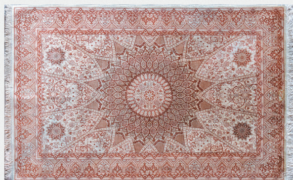
845 | IRAN

Tapis en soie de forme ronde à motif central en croix 300 / 500 €