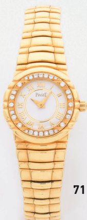
711 | PIAGET TANAGRA REF : 16033 M401D 1 500 / 2 000 €