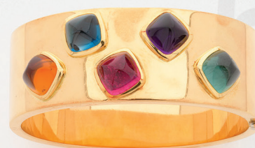
673 | BRACELET JONC 3 500 / 4 500 €