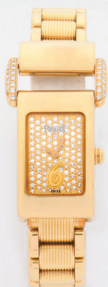
710 | PIAGET MISS PROTOCOLE REF : P10110 2 000 / 2 500 €