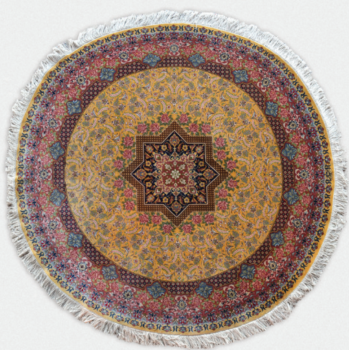
839 | IRAN

Tapis en soie de forme ronde à motif central en croix 300 / 500 €