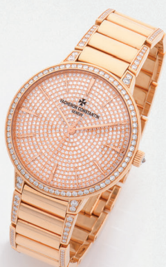
713 | VACHERON CONSTANTIN PATRIMONY REF : 86615 8 000 / 10 000 €