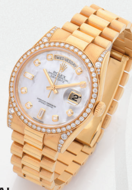
714 | ROLEX OYSTER PERPETUAL DAY DATE REF : 118388 10 000 / 12 000 €