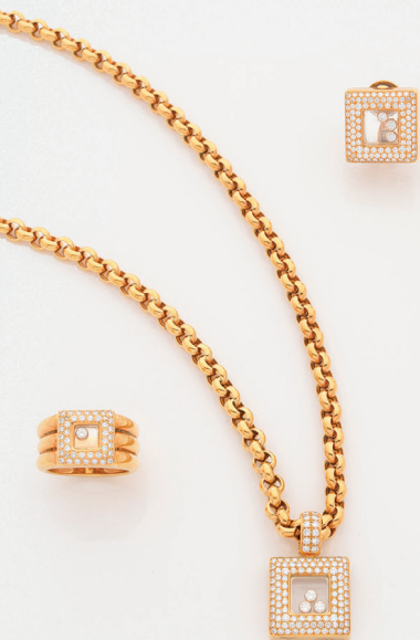
656 | CHOPARD DEMI PARURE « HAPPY DIAMOND » 2 000 / 3 000 €