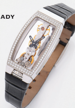
701 | CORUM GOLDEN BRIDGE LADY REF : 05.0053 1 500 / 2 500 €