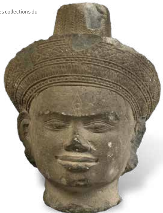
Figure dans l'inventaire du 13 décembre 1933 à Saïgon, p. 4, Cassette C.