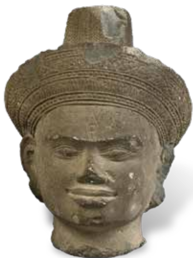
ART KHMER provenant de la collection de Monsieur Dalloz LOTS 215 À 229