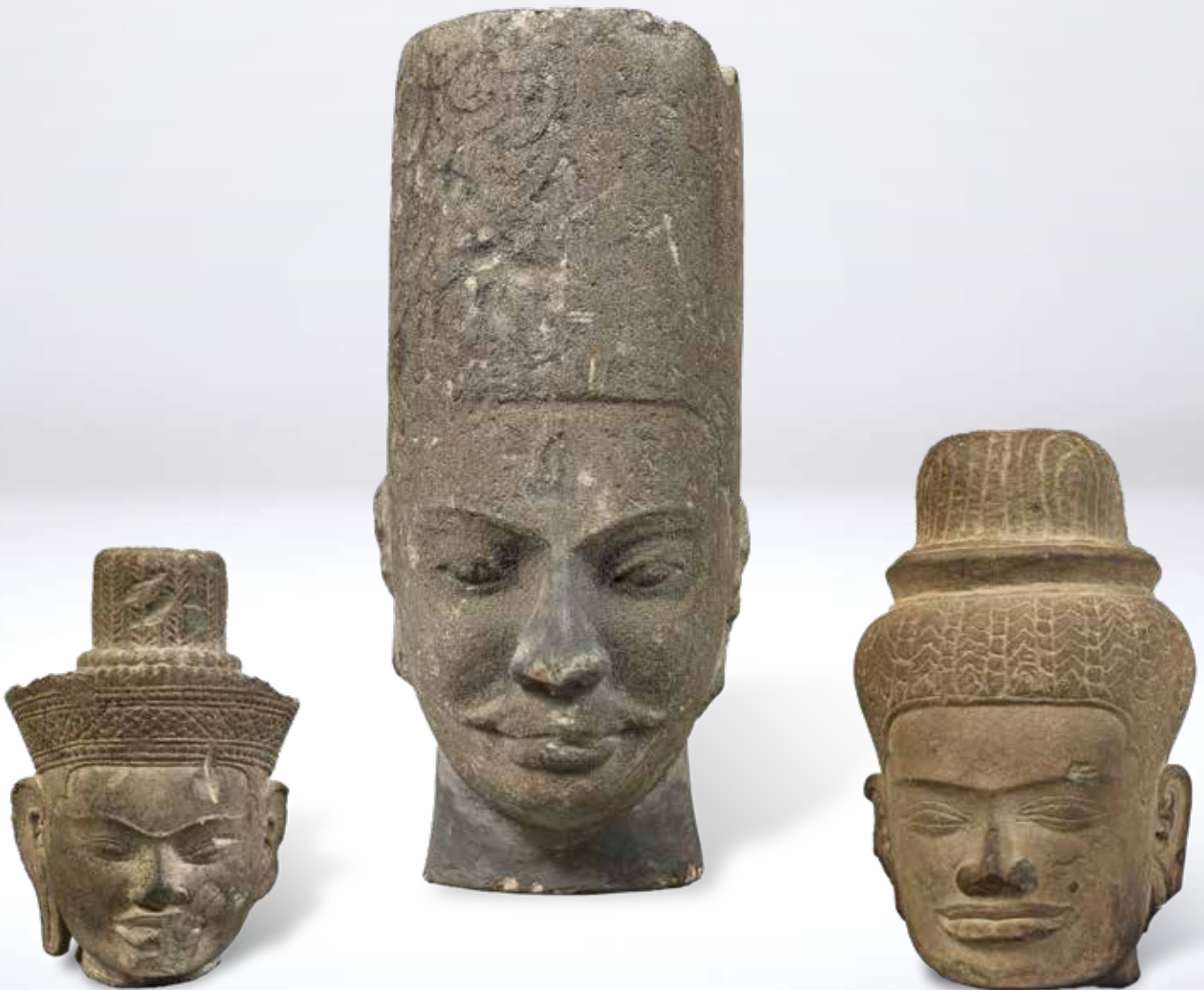
Figure dans l'inventaire du 13 décembre 1933 à Saïgon, p. 4, Cassette B ou C.