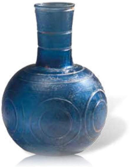
ARCHÉOLOGIE LOTS 64 À 89