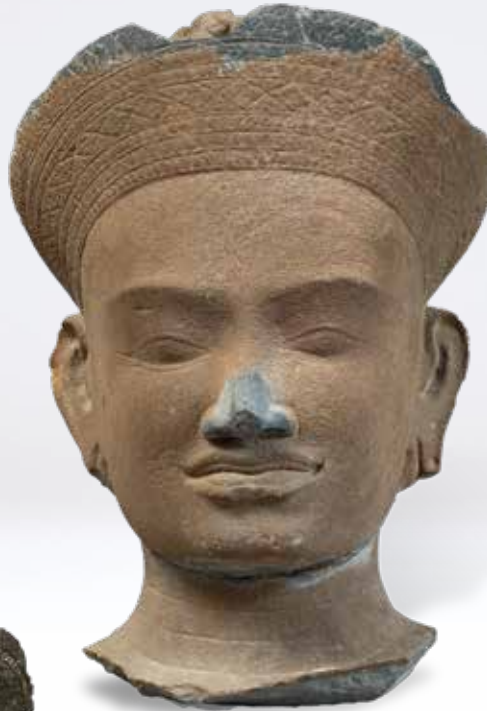
Figure dans l'inventaire du 13 décembre 1933 à Saïgon, p. 4, Casette B