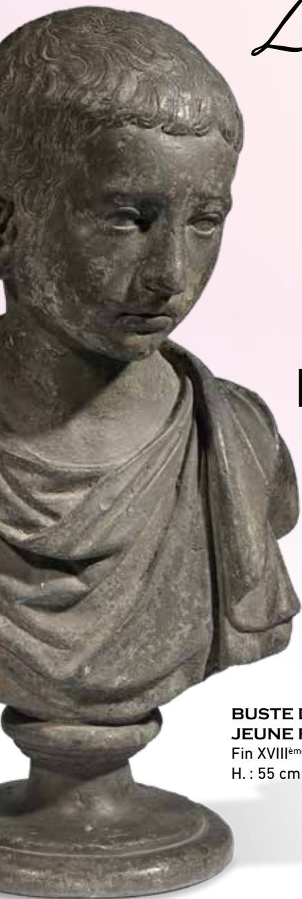
BUSTE D'ENFANT À L'ANTIQUE, DIT JEUNE PRINCE JULIO-CLAUDIEN Fin XVIII ème -début XIX ème siècle H. : 55 cm