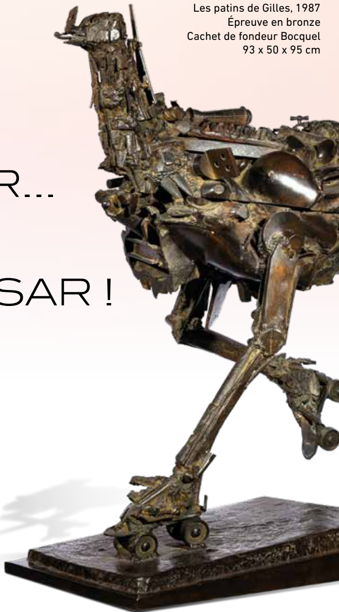
CÉSAR (1921-1998) Les patins de Gilles, 1987 Épreuve en bronze Cachet de fondeur Bocquel 93 x 50 x 95 cm