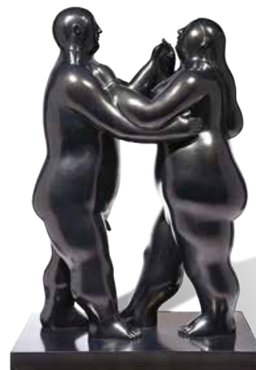
FERNANDO BOTERO Dancing couple, 2012 Epreuve en bronze à patine noire Adjugée : 1 400 000 €

Nous pouvons garantir sur le même contrat les œuvres d'art et de collection, les montres et les bijoux. Le contrat est adapté en fonction des nouvelles acquisitions et les biens sont assurés en monde entier et ce même en cours de transport.